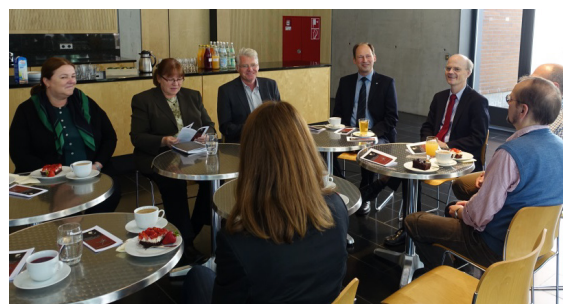
Impressionen aus dem Alfried Krupp Wissenschaftskolleg

Wichtige Erkenntnisse, die aus unserer Veranstaltung hervorgingen, waren, wie folgt: