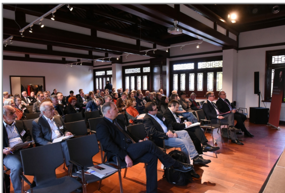
Blick in den Tagungssaal

Bei den Planungen zur diesjährigen Jahrestagung, die bereits vor längerer Zeit gestartet wurden, war dabei in keiner Weise abzusehen, welche gesellschaftliche Aktualität und Brisanz das Thema „Grenzüberschreitungen“ gerade auch im Hinblick auf die massiven Flüchtlingsbewegungen in Europa im Herbst 2015 neben dem bereits angesprochenen wissenschaftlichen Hintergrund haben sollte.