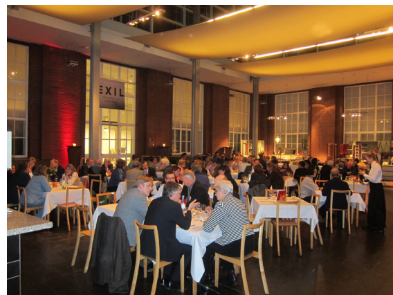
Der Humboldt-Abend im Museum für Völkerkunde