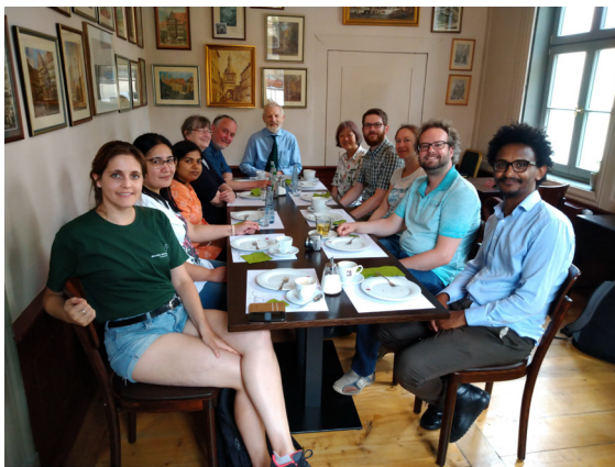
Exkursion nach Halberstadt.