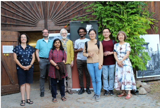
Westafrikanischer Abend.

In den letzten fünf Jahren haben wir immer eine Veranstaltung einem bestimmten Teil der Welt gewidmet – Äthiopien, Japan, Nepal, Brasilien, Kurdistan. Am 14. September veranstalteten wir auf unseren Dreiseithof östlich von Leipzig einen „westafrikanischen Abend“.