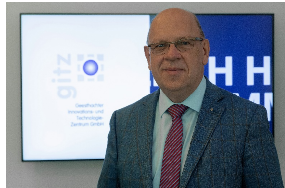
Der Autor