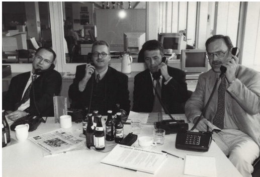
Hotline der Bergischen Gründungsoffensive „bizeps“ (exist 1998).

Netzwerken und Öffentlichkeitsarbeit ist gefragt. Bundesweit engagieren sich sogenannte Innovationszentren in der Unterstützung des Gründungsprozesses und des Technologietransfer. Sie beraten bei der Erstellung von Geschäftsplänen und stellen als eine Art Technologiehotel die Infrastruktur für Start-up-Unternehmen zur Verfügung. Forschungsinstitute und Hochschulen produzieren Wissen, das jedoch nicht zwangsläufig zu neuen Produkten, Verfahren oder Dienstleistungen führt. Auf der anderen Seite gelten mittelständische Unternehmen als Innovationstreiber in der deutschen Wirtschaft – insbesondere, wenn sie mit anderen Unternehmen und Forschungseinrichtungen kooperieren.