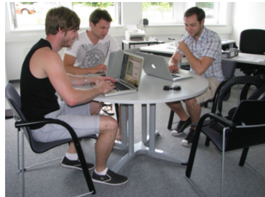
Gründer-Team im TZ Geesthacht.

In Schleswig-Holstein traf ich ganz überraschend die Humboldt-Familie wieder: Thomas Bosch hatte 2008 zur Gründung der „Kieler Regionalgruppe der DGH“ eingeladen.